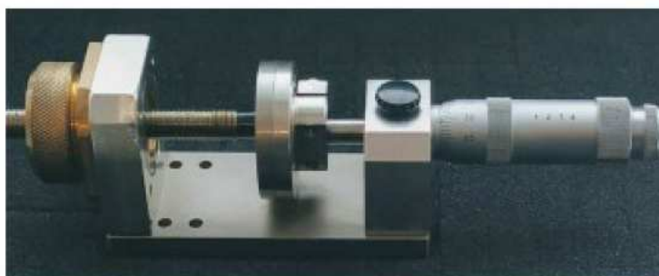
Внешний вид станда ILP-160